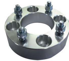
Ensemble de 2 Kit of 2