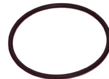
M10 X 1.25